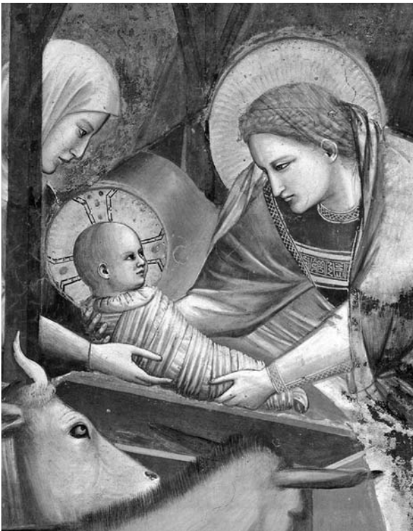
GIOTTO di Bondone: Jézus születése (1304-1306, Pádua)

Cursillo Alapítvány 1091 Budapest, Üllői út 145.