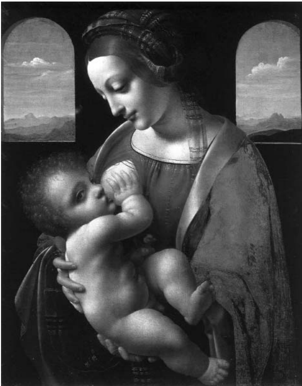
Leonardo da Vinci: Madonna Litta (1490-91)

Cursillo Alapítvány 1091 Budapest, Üllői út 145.