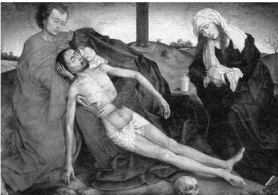
Rogier van den Weyden: Pieta (1441k.)

Minden kedves olvasónknak áldott húsvétot kívánunk!